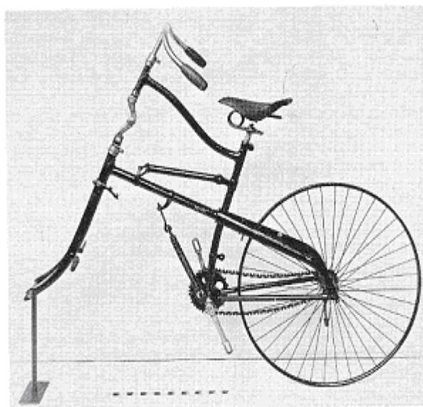
Figura 3: Whippet Spring Frame (1885) (15)