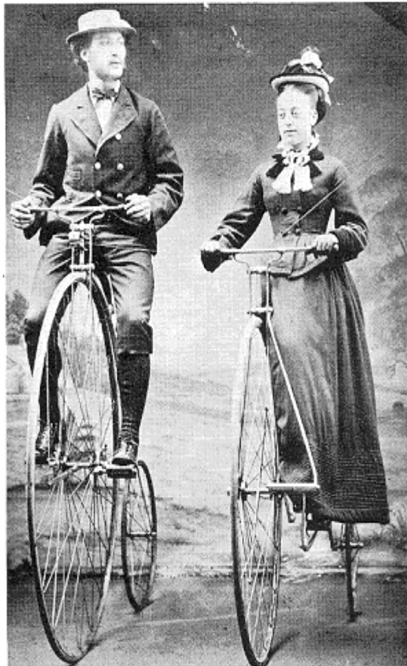
Figura 2: Bicicleta Ordinaria Modificada (14)

El problema anterior, gracias a la percepción de los diseñadores de bicicletas, y a la presión de los grupos sociales, suscitó el diseño de múltiples versiones de bicicletas que atendían este requerimiento de seguridad en mayor o menor medida. Prueba de ello son los diseños que se vinieron a conocer como Lawson's Bicyclette (figura 1), la "ordinaria" adaptada (figura 2), o la Whippet spring frame (figura 3), entre otras.